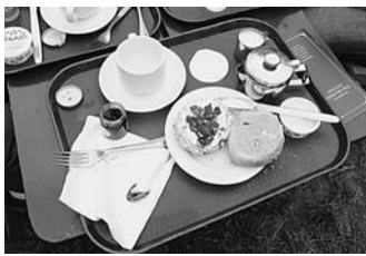
オーチャード・ティーガーデンの紅茶とスコーン

ケンブリッジでの研修では、より効果的な英語指導法をワークシヨップを通して体験することができた。また研修は、課題が与えられたり、私たちが実際に採用している教科書を使って模擬授業をしたり、デイベートしたり、バラエティーに富んだ内容であった。研修は毎日午前九時から、午後五時まで行われ、大変ハードではあったが、充実していたと思う。今回の研修で培ってきたことを少しでも生徒に還元できればと思っている。