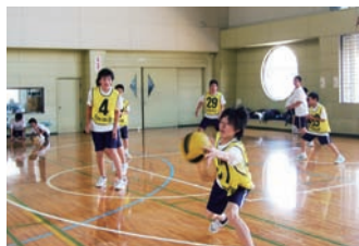
中学校体育祭 (ドッジボール)