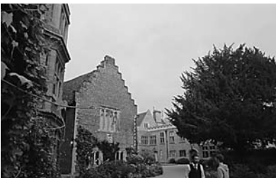
キャンパス内の風景～図書館周辺