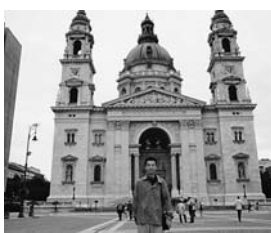
聖イシュトバーン教会前 8月1日ブダペスト

最初にペスト方面を見学、聖イシュトバーン教会（ハンガリー建国の父といわれ、聖人となったイシュトバーン王ゆかりの教会、英雄広場などを見学した。王宮へはケールカーで移動、王宮周辺を中心に、マーチャールシュ教会や漁夫の砦など観光地を見学、現在もローマ時代の王宮遺跡が残され、中には新婚カップルが遺跡の前で写真撮影をしていた。三日に世界遺産のパンノンハルマのベネディクト修道院及び自然景観を見学した。広大な牧草地域が広がり、中世の街並みを残していた。この教会にはハプスブルク家の王族の人々の心臓が納められており、歴史を感じさせられた。四日はオーストリアの都ウィーンを訪れ、七日はスロヴァキアのブラチスラヴァへ電車で移動、八日にはウィーンより電車で五時間かけてチェコのプラハを訪れた。プラハは以前ボヘミアといわれ、神聖ローマ帝国の都であり、長らくハプスブルク家の支配を受けていたところだ。やがて、第一次世界大戦がはじまり、ハプスブルク家の終焉とともに、チェコはチェコスロバキア共和国に、やがてソ連の支配を受け、チェコとスロヴァキアが分離・独立し、共にEUに加盟している。今なお中世の面影と歴史の重さを感じながら、プラハの町を後にした。