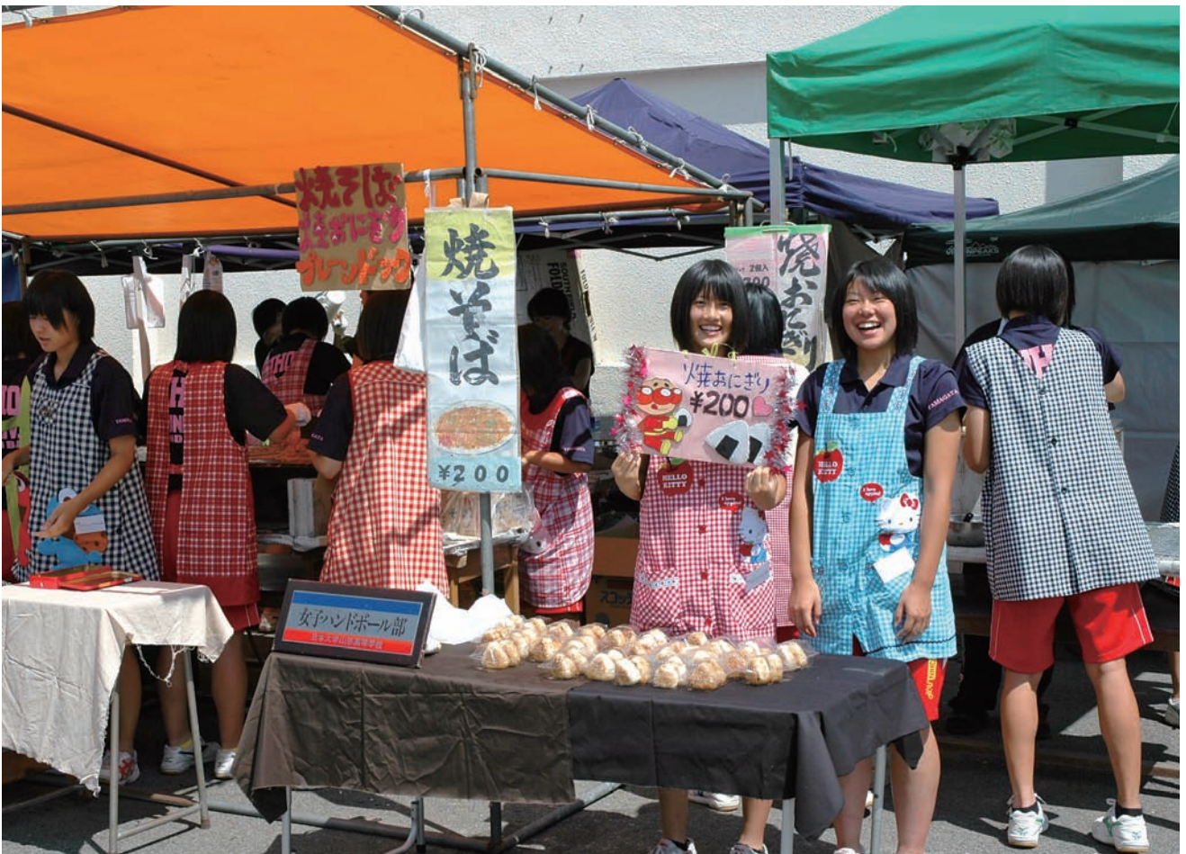
笑顔が溢れる桜華祭