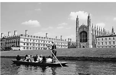
テム川でのパンティング