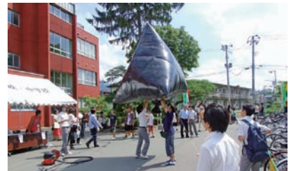
中学校科学部の熱気球の実験

日本大学山形高等学校・中学校広報部 〒990-2433 山形市鳥居ヶ丘四一五五 電話 〇二三一六四一―一六六三二(代) FAX 〇二三一六四一―一六六三四 URL http://www.yngt.hs.nihon-u.ac.jp 印刷 (株)大風印刷