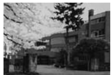
閉校記念品「タペストリ」