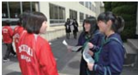
部活動勧誘の一コマ