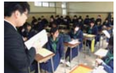
初めてのホームルーム