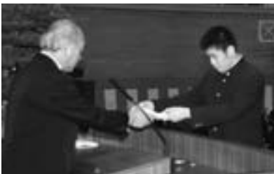
表彰を受ける卒業生