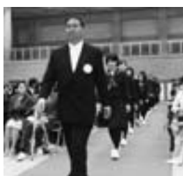
担任の先生を先頭に入場

います。どうか一日も早く本校の生活になじみ、自分を大切に、人をおもいやり、互いに切磋琢磨できる明るく楽しい学校生活を過ごしてください。 次に保護者の皆様に申し上げます。私も教職員一同は、ご列席の保護者の皆様に対しまして、これまでのご労苦をねぎらい申し上げ、併せて限りない可能性に富む新入生の入学を心から祝福し、歓迎いたします。そして、本校の総力を結集して、教育成果を最大限に高めたいと決意を新たにしております。 しかし、教育の成果は学校の努力のみでは達成できません。教育は、家庭教育がまず、第一歩とも言えます。基本的な生活習慣、「躰」は、しっかりとお願いしたいと思っております。保護者の皆様におかれましては、本校の教育方針をご理解いただき、密接な連携を保ちながら、積極的なご支援ご協力をお願いしますようお願い申し上げます。 新入生のみならず、あらためてご入学おめでとうございませう。勉学に、学級活動に、そしてクラブ活動や生徒会活動を、大いに楽しみ、有意義に過ごし、大いに躍進されることを願っております。そして、本校で学んだ時間が皆さんの人生の中で最も輝いたものになることを心から期待して、式辞といたします。