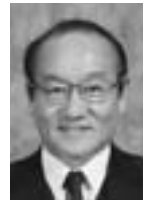
「思いやり」そして「切磋琢磨」