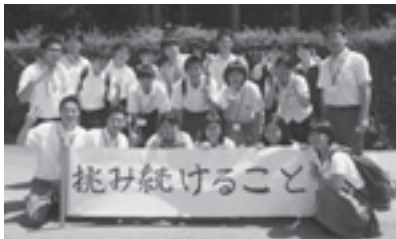
Aグループの仲間たち

今回初めて参加した付属高校生サミットでは多くのことを学ぶことができました。最初は緊張したものの、すぐに仲間と打ち解けることができました。自分の考えをしっかりと持ち、それを言える場所があり、他人の考えも知ることができました。他の付属校の現況等も知ることができたことは大きな収穫です。本校に生かせることを見つけたいと思っています。