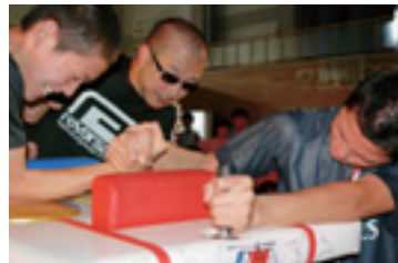
猛者決定戦 ~桜華祭~