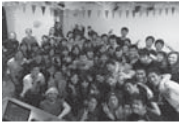
ダンスパーティー

また、このプログラムでは他の日本大学付属高校生との交流も兼ねており、共に寮生活をしながら中々で強い友情を育むことができました。私は誕生日をこの期間中に迎えたのですが、沢山の人が祝ってくれて、お祝いパーティーまで開いてもらい、本当に感激しました。この仲間たちとはこれから連絡を取り続けたいか皆で会う日が絶対に来るでしょう。刺激を受け続けた十八日間ではより海外留学