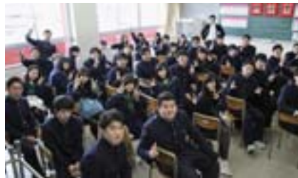
最後のホームルーム